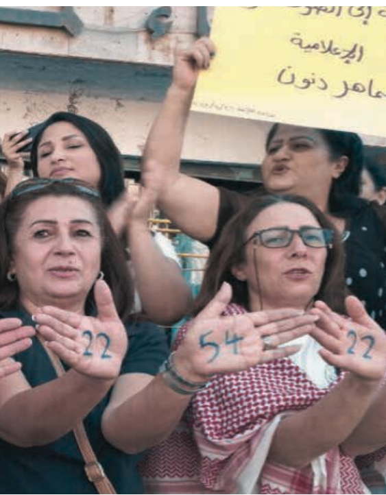
نساء يرفعن لافتة تطالب بالانفصال عن المهر.