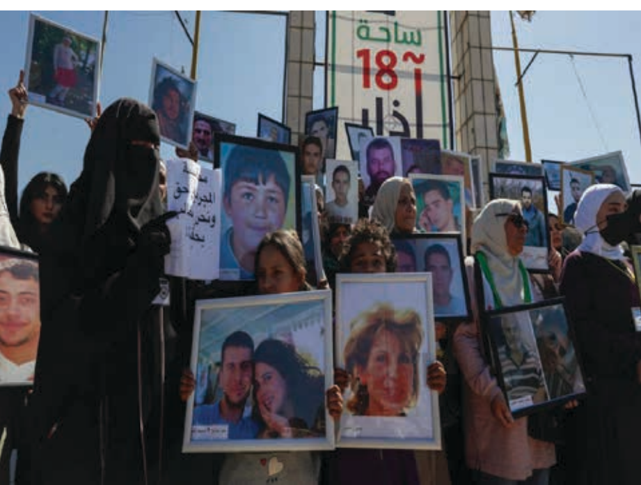
"نحن لا نملك سلطة سياسية، لكن نملك الحق في حفظ ذاكرتنا. نخشى أن يأتي يوم نكتب فيه القصة بشكل مغاير، لذلك نحافظ على شهادات الناس كما هي."

وفي الوقت الذي تواجه فيه الزراعة أزمة متفاقمة، تعيش مدينة حماة مرحلة حساسة فيما يتعلّق بتأمين مياه الشرب، الأبار الجوفية انخفضت مناسيبها، وتراجع غزارة العديد من الينابيع والآبار السطحية، ما دفع الجهات المختصة إلى إصدار تعليمات بتقييد استخدام مياه