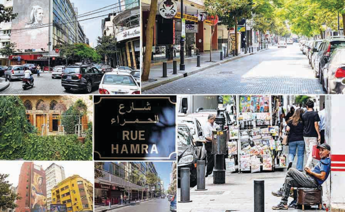
شارع الحمراء في بيروت، لبنان

هذه المدينة – النموذج لم تكن لتولد في بلد يحمل السلاح داخل الحدود ويلوح به خارجها، يتعزّل بالحرب أو يفرّض إيديولوجيا رسمية واحدة. وعليه، فإنّ شرط إحياء الحمرا اليوم هو، ببساطة، موت