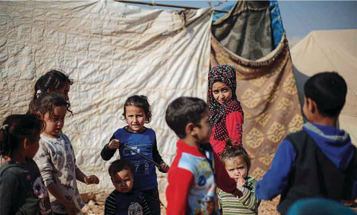
العدد ٢٩٤ - الأربعاء ١٩ تشرين الثاني ٢٠٢٥ م

ولا يقتصر تأثير زواج الأقارب على الجانب الصحي فحسب، بل يمتد إلى العلاقات الأسرية، حيث تتدخل العائلات بشكل مستمر في تفاصيل الحياة الزوجية بحجة القرابة، ما يجعل المرأة أكثر عرضة لفقدان استقلاليتها.