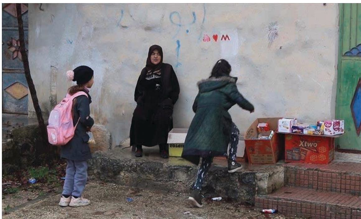
أرملات في سوق القنيطرة

العملية تتأثر بنقص المنتجات، ما يزيد الأعباء المالية على الأرامل اللواتي يعتمدن على هذه الأسواق لتأمين دخل أسرهن.