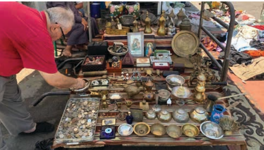
العدد ٢٨٨ - الأربعاء ٨ تشرين الأول ٢٠٢٥ م

على ركح صغير، يؤدي دوره بآبئان، فضائل المتسوقين وتحفزهم على الشراء. ولكن وراء هذه الألحان الشجية، تفتك حكايات إنسانية تروي معاناة يومية. فالبايع الجائل ليس مجرد بائع، بل هو رب أسرة يحمل على كاهله مسؤولية إطعام أطفاله، وهو يعيشون حالة من عدم الاستقرار، خائفين من دوريات البلدية التي قد تصادر بضاعتهم في أي لحظة. إنهم مثل البدء الرحل، لا يحملون همّاً مشتركاً هو البحث عن لقمة العيش في زمن صارت فيه اللقمة عسبية على المنال.