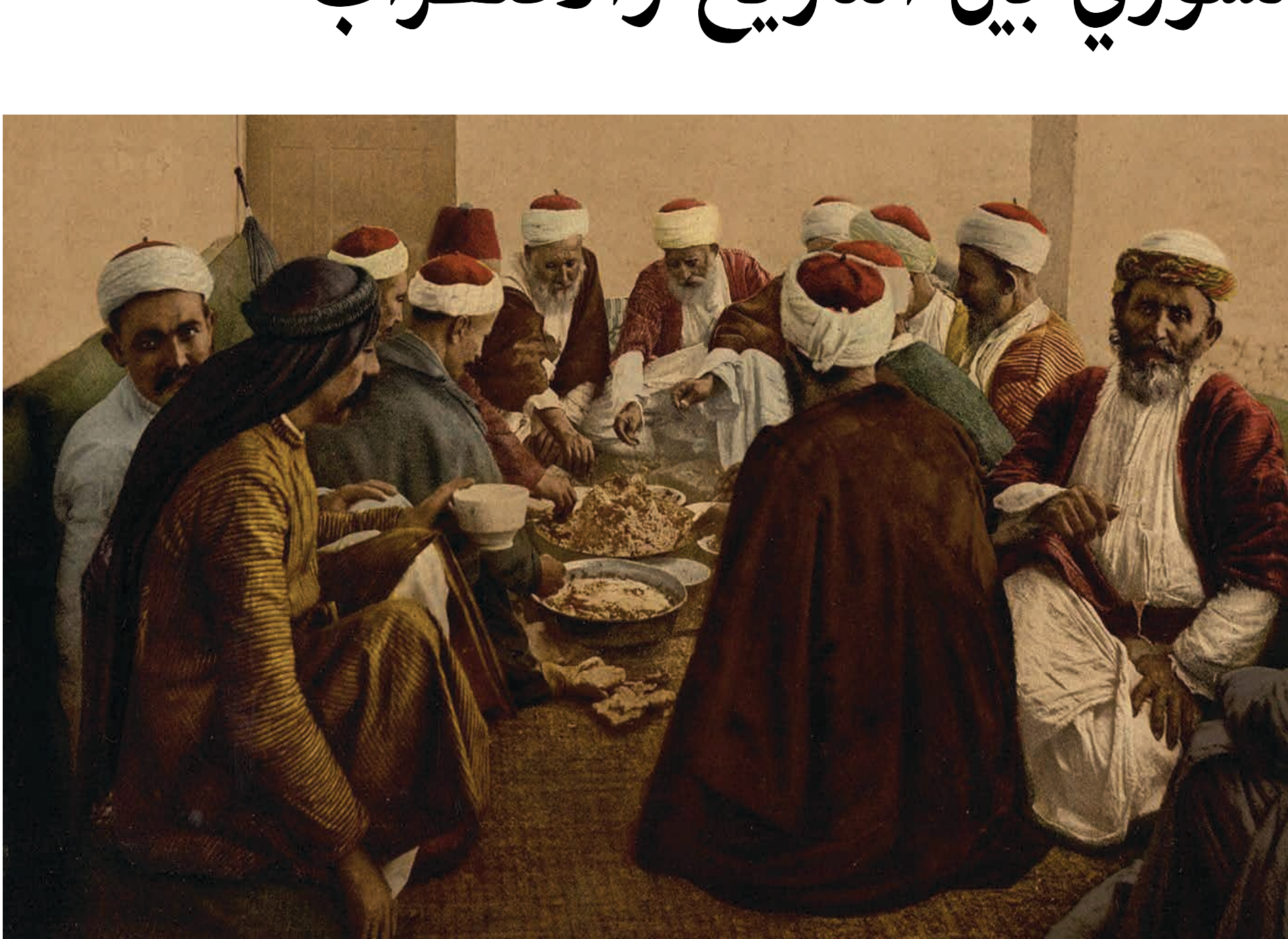
تقرير/ رجاء مختار

يعيش الجنوب السوري منذ قرون حالة فريدة من التداخل الاجتماعي والتاريخي بين مجتمع جبل الدرزى من جهة، والقبائل البدوية المنتشرة في بادية