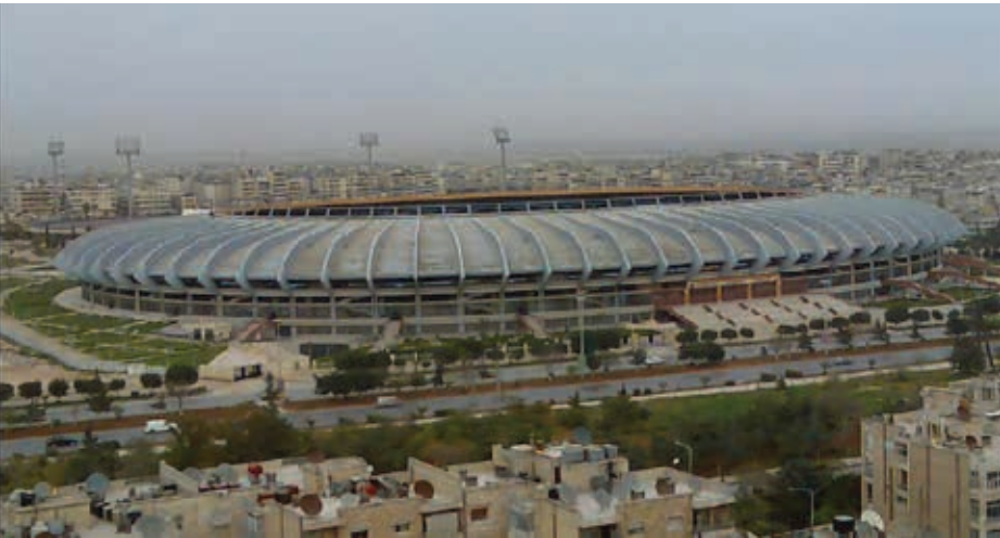
تمهيداً لبناء قاعدة قوية من الناشئين».

هذا التراجع لا يقتصر على نشاط الملاعب فحسب، بل انعكس على المجتمع المحلي الذي كان ينظر إلى الرياضة كجزء أساسي من حياته اليومية. وبينما يعزو البعض الأمر إلى غياب الاستثمارات