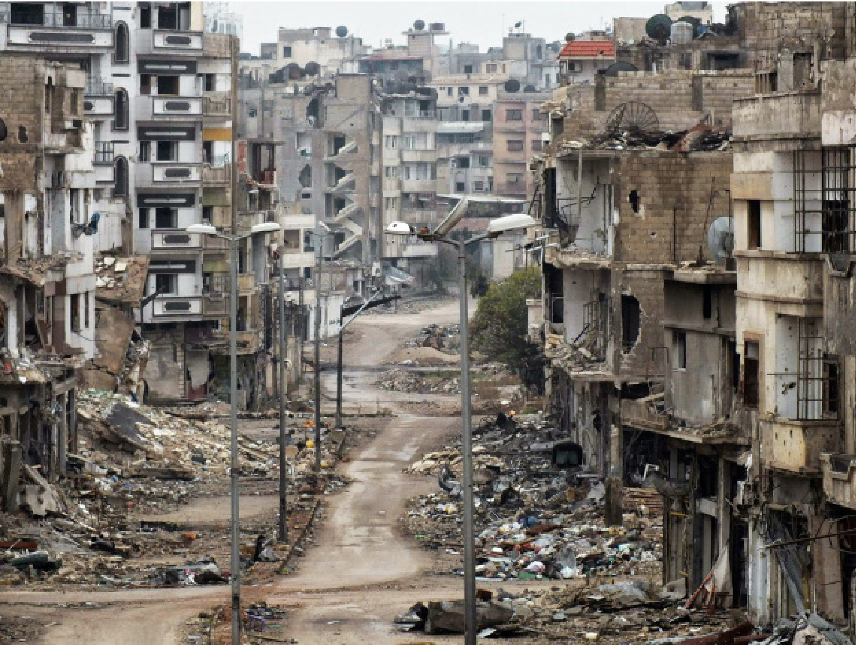
تحقيق/ جمانة الخالد

بينما تمثل إعادة الإعمار في سوريا فرصة استثنائية للدول وشركائها، تشكل في الوقت ذاته تحدياً ضخماً أمام أي حكومة سوري مقبلة، في ظل الدمار الهائل الذي طال البنية التحتية والقطاعات الحيوية، مما يعكس حجم المهمة الشاقة التي تنتظرها.