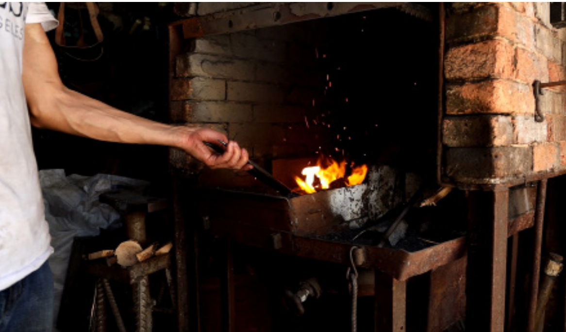
إعداد/ سلاف الطني

مهنة تاريخية قديمة قدم التاريخ والتي سادت لعقود طويلة وتربعت فيما مضى على عرش مهن ذلك الزمن، هي مهنة الحدادة، بالرغم من التقدم التقني والتكنولوجي الذي شهدهته حياتنا المعاصرة، يبقى للمهن والحرف اليدوية، الأثر الكبير في المجتمع الذي ينتمي لإرث إنساني عريق، مهن بقي بعضها، فيما يجهد بعضها الآخر ليظل على قيد الحياة بانتظار من ينقذ.