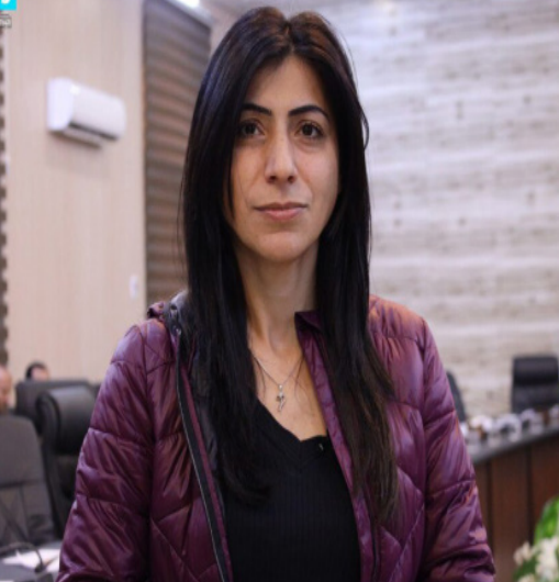
عدالت عمر، رئيسة هيئة المرأة في الإدارة الذاتية الديمقراطية في سوريا

وأضافت عمر أن المرأة السورية لن تنتظر من يحدد حقوقها أو دورها في المجتمع، بل ستعمل بإرادتها الحرة على صياغة مستقبلها وتحديد حقوقها في