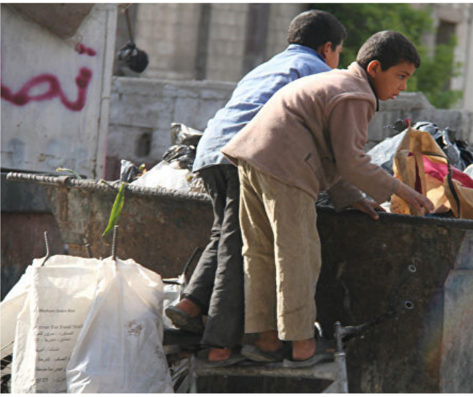
مهجرون فيدمشق، في أحياءدمشقالتي دُمِّرَت.

ويخشى سكان دمشق من فرضى السلاح وانتشار اللصوص بعد فتح السجون