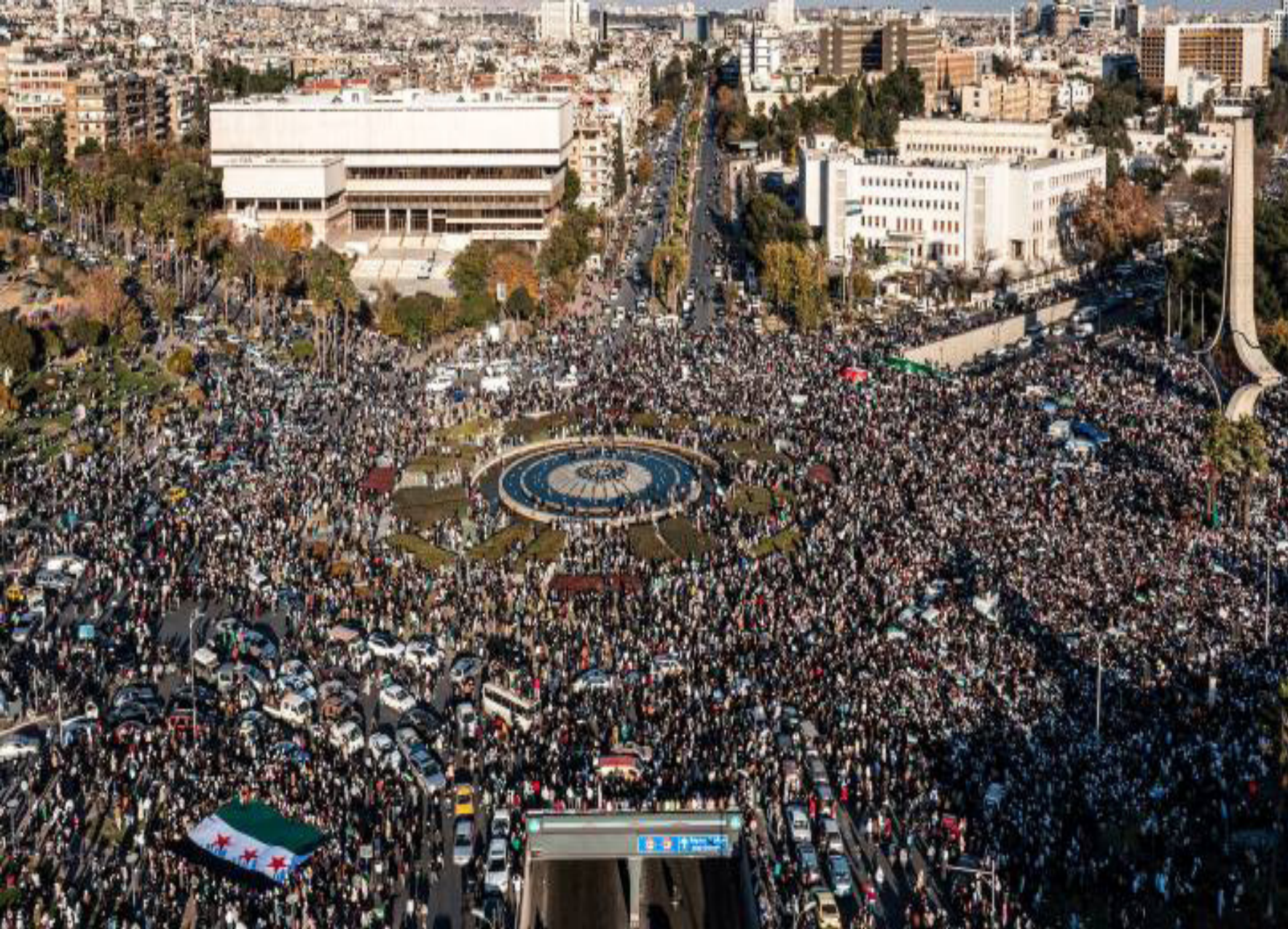
تقرير/ خالد الحسين

لا يزال السوريون يتوافدون إلى ساحات وميادين بلادهم، احتفالاً بما يقولون إنه نهاية عصر الديكتاتورية، والقمع، ومصادرة الحريات، باحثين عن بقايا صور كما يصفوه بـ«الرئيس المخلوع الهارب» بشار الأسد، وتمثيل والده الرئيس الزاحل حافظ الأسد، بالشوارع العامة، وإزالتها، وإسقاطها، في مشهد ما كان ليظهر ببалهم قبل أسابيع، لكن أمام هذا المشهد الاحتفالي الشعبي، لا يُخفي السوريون النخبويون مخاوفهم، وتساولاتهم عن مشهد سورية ما بعد الأسد، في ظل سيطرة هيئة تحرير الشام، وزعيمهم أحمد الشرع المُلقّب بالجولاني.