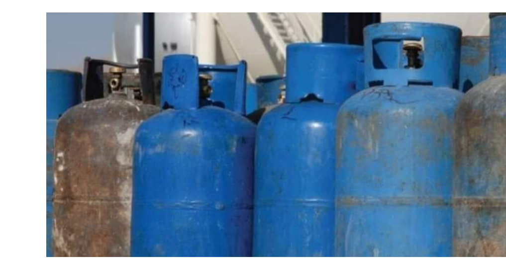
أسطوانة الغاز المنزلي بوزن ١٤ كيلوغراماً

الحياة اليومية للمواطنين فقط، بل تمتد لتعيق الأعمال والأنشطة الاقتصادية. وتبقى الإجراءات الحكومية لمعالجة هذه الأزمات محدودة وغير كافية، حيث تستمر حكومة النظام في تقديم الوعود من دون تنفيذ فعلي يللمسه