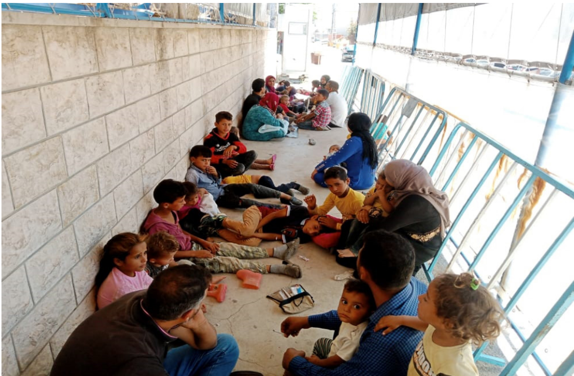
حباتيم أينما كانوا.

وطالب المبعوث الأممي «باحترام سيادة سوريا وجميع الدول في المنطقة»، مشيراً إلى أن «الحاجة إلى أعلى درجات ضبط النفس والهدوء أكثر إلحاحاً من أي وقت مضى، بما في ذلك خفض التوتر عبر المنطقة بأكملها، وكذلك داخل سوريا وصولاً إلى وقف إطلاق نار شامل وفقاً لقرار مجلس الأمن ٢٢٥٤».