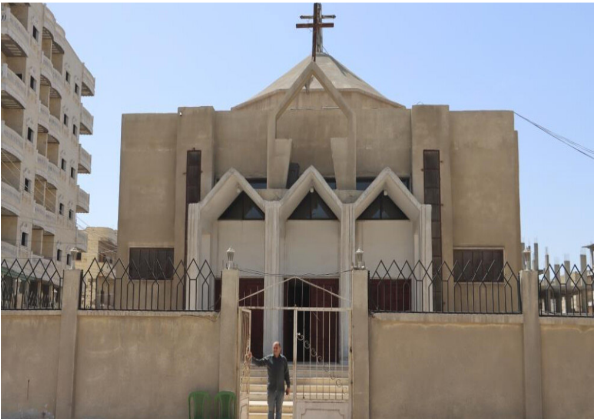
المقدسات والمكتسبات الاجتماعية: