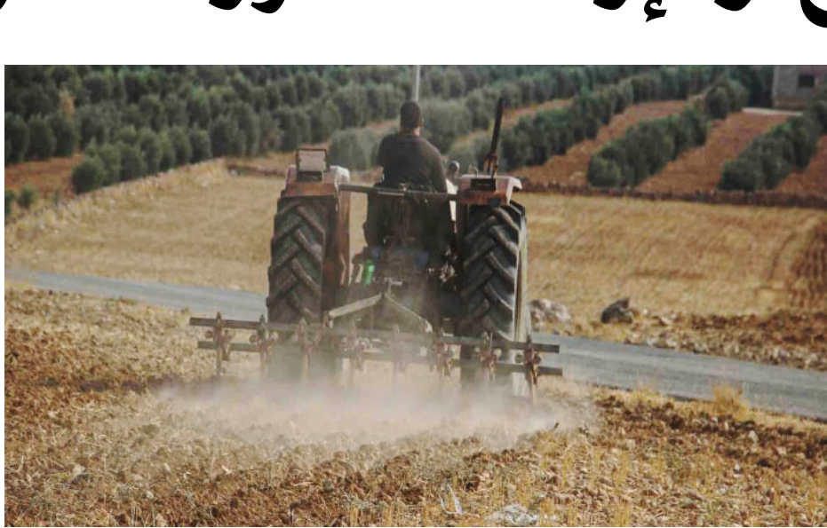
تقرير/ خالد الحسين

وتتفي الجمعية الحرفية للمطاعم بحماة، أن يكون دور للجمعية بتحديد الأسعار بل يقتصر على توزيع الشهادات الحرفية للأعضاء، كما أنها ليست مسؤولة عن توزيع مخصصات الغاز والمازوت، حيث يتم توزيع تلك المخصصات من قبل لجنة تضم ممثلين