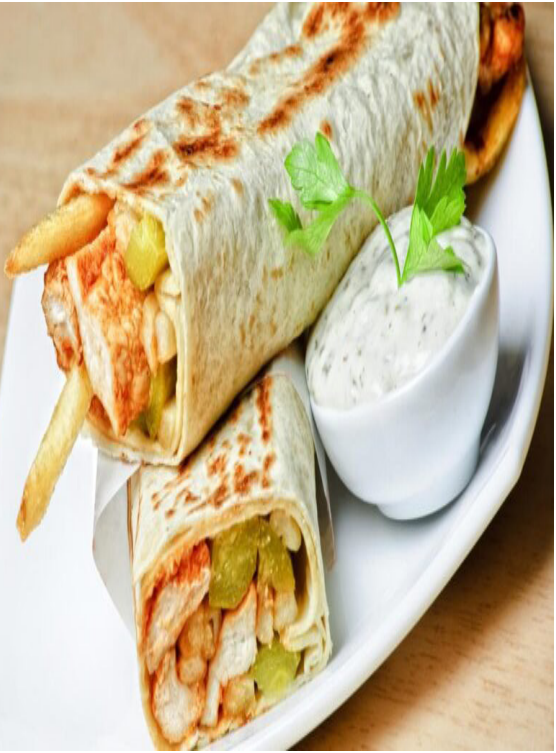
تقرير/ مرصدة إسماعيل

والوقاية من هذه الأمراض، يجب اتباع ممارسات زراعية سليمة مثل التهوية الجيدة للحقل، عدم تجاوز الكثافة النباتية، واستخدام الأصناف المقاومة للأمراض عند الزراعة.