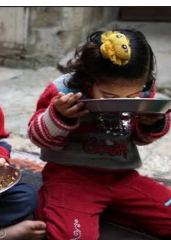
في ظل الأزمة الاقتصادية الحالية يبقى الفرد مرتبكاً لجهة تأمين احتياجاته طوال الشهر ولايسمى

وفي ظل الأزمة الاقتصادية الحالية يبقى الفرد مرتبكاً لجهة تأمين احتياجاته طوال الشهر ولايسمى أمام هذه الموجة التضخمية التي تتراقب مع ارتفاع العديد من السلع وعلى رأسها المواد الأساسية التي تعتمد عليها الأسرة، كالمنتجات الغذائية والاستهلاكية الضرورية للمواطن، والطاقة وغيرها.