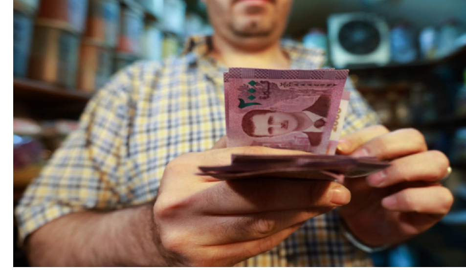
تقرير/ جمانة الخالد

باتت الحوالات المالية بمثابة الملاذ والخلص للسوريين في ظل تردي الواقع المعيشي، الذي أدى إليه انهيار قيمة الليرة السورية وتكدى الأجور، وحالة التضخم التي ضربت الأسواق السورية خلال السنوات الماضية. وتعتمد معظم العائلات المقيمة في حمص وحماة ووسط سوريا في تأمين معيشتها وحاجاتها اليومية، على الحوالات الخارجية، وخاصة خلال فترة شهر رمضان المبارك ومواسم الأعياد.