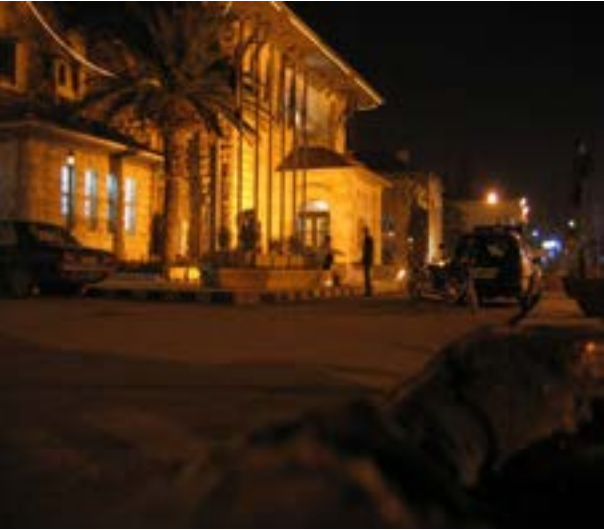
محطة بغداد من اقدم محطات القطار في حلب

تم وصل محطة بغداد مع خط قطار الشرق السريع في برلين- بغداد، ورواية اغاتا كريستيني بعنوان « جريمة في قلب الشرق السريع»، ادخلت محطة بغداد في سجل التاريخ.