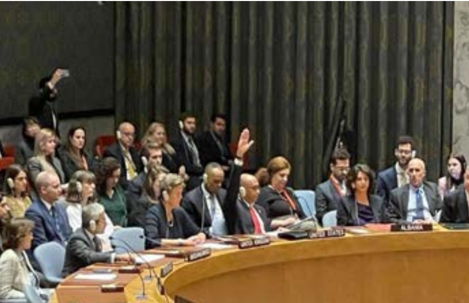
نتنياهو مع أعضاء حكومته