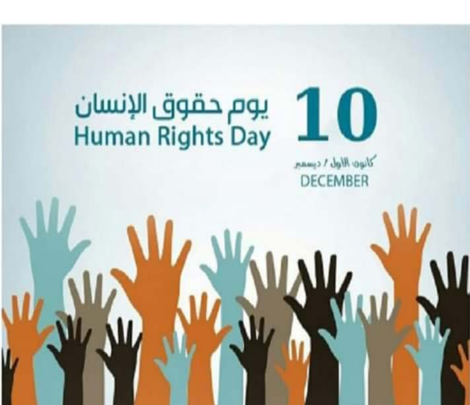
10 كانون الأول / ديسمبر

كما جاء في المادة (١٨) من الإعلان إقرار حرية إبدال الدين أو المعتقد. فموقف السعودية هذا يندرج ضمن جدلية الخصوصية / العالمية، وهذه مسألة لا يبدو أن الصكوك الدولية لحقوق الإنسان تنتكر لها، فمن المستحيل تخيل وجهة حجج النسبية الثقافية أو الخصوصية لتتحلل من حق الإنسان في الحياة أو من حرمة الجسم والسلامة البدنية والعقلية أو من تحريم الرق والاعتقال أو النهي التعسفيين. هذه الحقوق تتصل اتصالاً وثيقاً بالركائز الأساسية للكرامة الإنسانية، بصرف النظر عن منظومة القيم التي يرتبط بها الفرد.