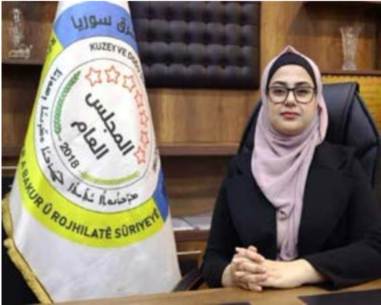
تقرير/ مطبعة الحبيب

ويحدد العقد الاجتماعي “الجديد” شكل الإدارة وهيكلتها، ويشمل مفوضية الانتخابات، التي ستشرف على الانتخابات المزمع عقدها.