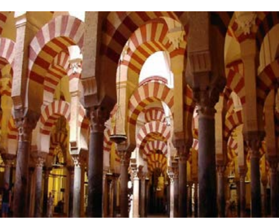
والحجاز والعراق واليمن.

والمشربيات من العناصر التقليدية التي تعلق المنازل كعنصر معماري توضع غالباً على نوافذ الطوابق العليا لتحبب الظلال والبزودة في الصيف وقد اعتاد الناس في حماة قديماً على وضع أواني الشراب الفخارية في المشربيات.