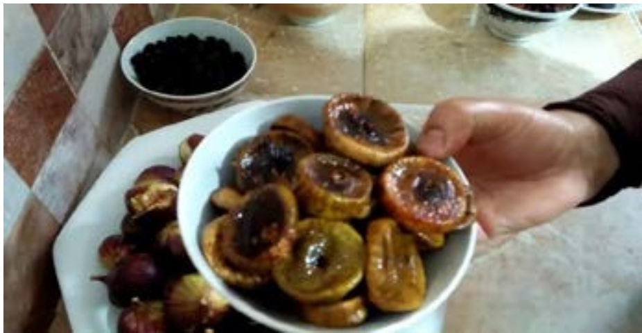
بيت المونة، وهو عبارة عن طبق من الخضراوات والبقوليات والمخللات والمرببات والحبوب والنباتات والسكر والزهور والأعشاب، وكثيراً ما تُغطي المونة حلة أهل البيت لسنة وأكثر، ويتم تخزين كل ما يمكن تخزينه في ذلك المكان الذي يُسمّى

جرت العادة السورية في كل المحافظات دون أي استثناء أن يكون هناك وقت في السنة (في الصيف) يُقال له وقت (المونة) أي المون، فالسوريون ولأن طعامهم يشمل كل أنواع الخضراوات التي قد لا تتوفر في الشتاء، وجدوا أنه من الواجب أن يحتفظوا أنواعاً من الطعام بمختلف الأشكال والطرق، لتكون ذخيرة يستعينون بها في أيام الشتاء وقلّة المواد الغذائية.