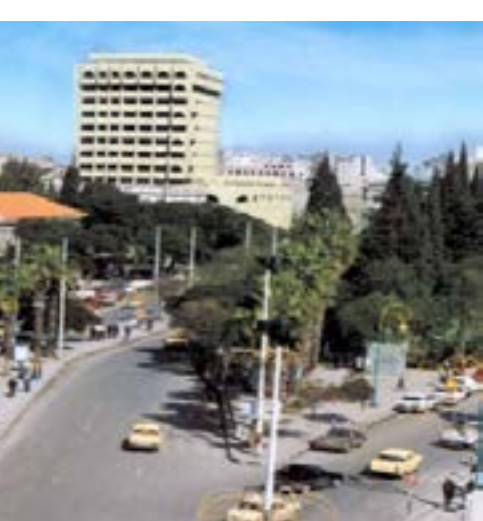
سوق العقارات في حمص

وتشهد سوق العقارات في حمص حركة بيع جيدة قبل فترة، وكانت الرغبة بتأمين تكاليف السفر خارج البلاد على رأس الأسباب التي تدفع الناس لعرض العقارات في بعض المناطق، حيث تراجعت الأسعار لنسبة ضئيلة تراوحت بين ١٠ و٢٠ بالمئة لنفس السبب.