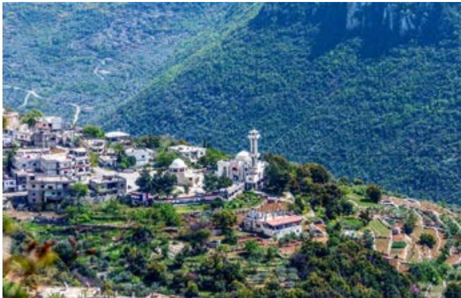
معرين الغربية نبع واحد .