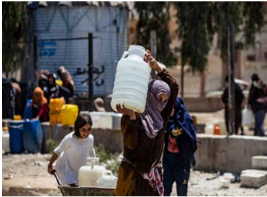
الكهرياء الواصل للمحطة.

كما يعود أسباب ارتفاع تكلفة الإسمنت للتجار لزيادة الطلب على الإسمنت في ظل عجز الحكومة بكبح جشع التجار، والذين يجعِدون سبب الأزمة للغزو