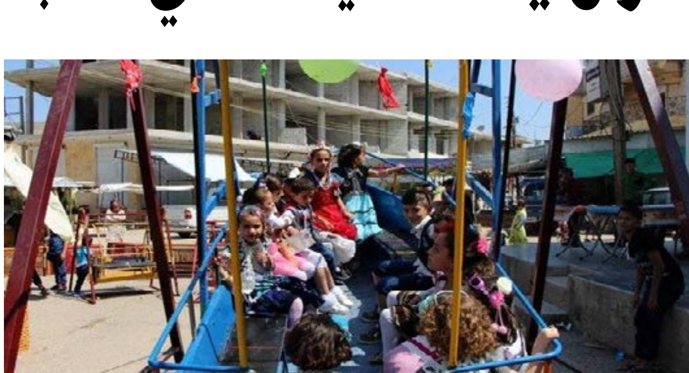
مشترك في الاحتفال بالعيد بين سوريا وباقي البلدان، ففي سوريا يتم إقامة مساحات كبيرة للأطفال.

تُعتبر الأعياد واحدة من أهم المناسبات التي تمر على الأم، والأمة الإسلاميّة كباقي الأمم؛ لها أعيادها التي تحتفل بها، فالمسلمون يحتفلون بعيدين في العام الواحد هما: عيد الفطر الذي يأتي بعد شهر رمضان المبارك، وعيد الأضحى الذي يأتي في شهر ذي الحجة في فترة تأدية المسلمين لعبادة الحج.