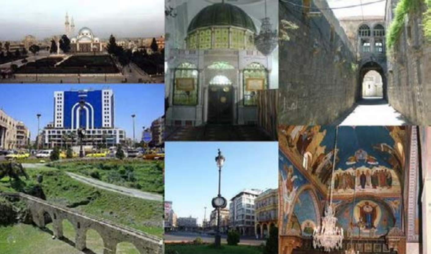
جميلاً للمسرح الصغيرة في سورية، وكذلك المتحف والحمامات والمعد الإمبراطوري.