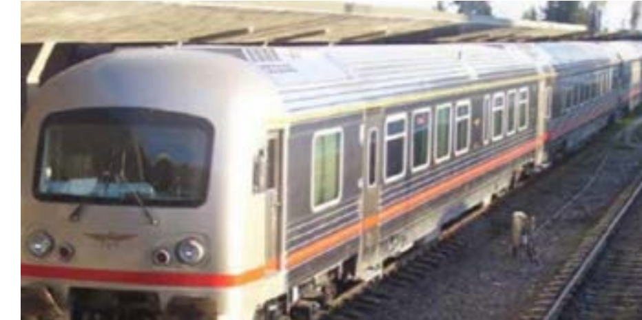
وبالعكس: ٣٠٠ ل.س والمخفض ٢٠٠ ل.س والجريج ومرافقه ١٠٠ ل.س

طرطوس/ان من أجل المساعدة في إيجاد بعض الحلول لمشكلة النقل لدى المواطنين ولتقديم أكبر عدد ممكن من أبناء مدينة بانياش للسفر بالقطارات، اعتباراً من بداية الأسبوع الحالي العمل على تخديم الركاب بالقطارات عبر كافة الرحلات التي يتم تسيرها بين محافظتي طرطوس واللاذقية في الموقف الذي تم إعداده مؤخراً بين محطتي بانياش وخليج مرفية عند جسر القوز، لتأمين صعود ونزول الركاب منه وبأنه ذلك بالتزامن مع قيام المؤسسة بإجراء بعض التعديلات الطفيفة على مواعيد سير قطارات الركاب بين هاتين المحافظتين بما يتناسب مع تخديم أكبر شريحة من المواطنين.