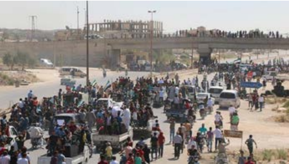
تاريخهم ومحو ذكرياتهم.

الوطني، وبالتزامن مع حلول عيد النوروز، على جرف أكثر من ٩ منازل في قرية عين حسان جنوب غرب مدينة رأس العين، بالإضافة إلى جرف بيئتهايها لتحويل القرية إلى