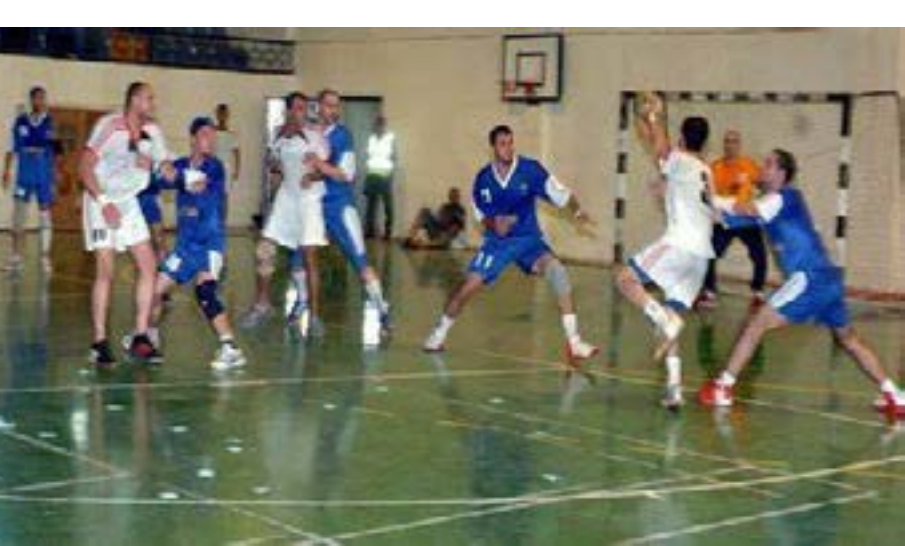
فوز المنتخب السوري بكرة اليد في بطولة كأس العرب ٢٠٠٧

قاعدة عريضة لرياضة كرة اليد السورية، وكانت تهيمن عليها، والسبب في ذلك حب هذه اللعبة، والمتابعة الجادة من قبل جمهورها الواسع الذي يتابع جميع اللقاءات التي تقام على أرضه وخارجها.. ما شجّع على تحقيق الفوز على أندية أكبر عراقة ونخبة.