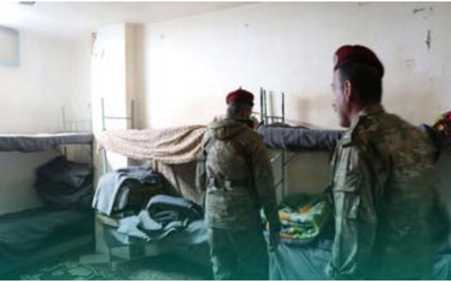
وتكون بحراسة أربعة عناصر، عنصران

مروره في حي الكاشف بمدينة درعا، مما أدى إلى مقتله وإصابة أفراد عائلته الذين كانوا معه بجروح متفاوتة، وتم اسعافهم إلى المشفى الوطني في درعا. وقتل عضو في اللجنة المركزية بالريف لواء الثامن التابع للفيلق الخامس، مما أدى إلى حلة من التوتر الشديد وقطع الطرقات الرئيسية وإتساع إطارات السيارات فيها قبل أن يتم الإفراج عن ثلاثة منهم وإبقاء شقيقهم الرابع قيد الاعتقال. وخلال ذلك اعتقل حاجز أمّتي ثلاثة عناصر من بلدة صيدا شرقي درعا أثناء توجههم إلى مدينة درعا، فقام بعض أبناء البلدة بقطع طريق دمشق بالقرب من بلدة صيدا