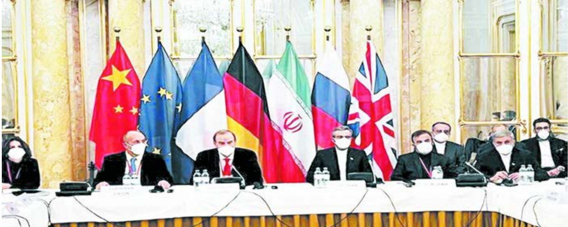
اجتماع وزراء الخارجية في فيينا