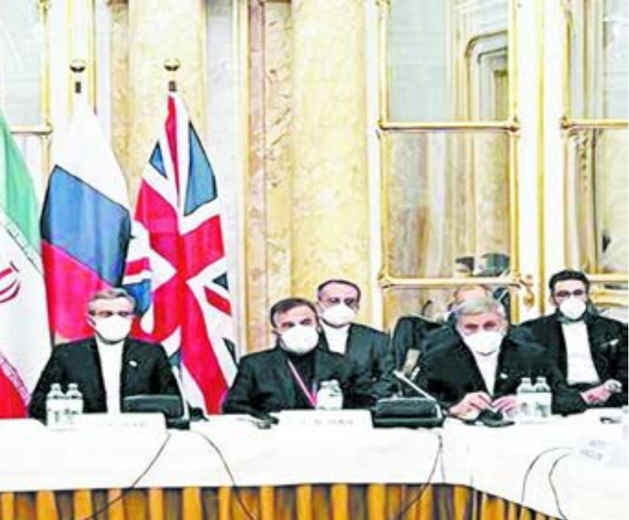
اجتماع وزراء الخارجية في فيينا