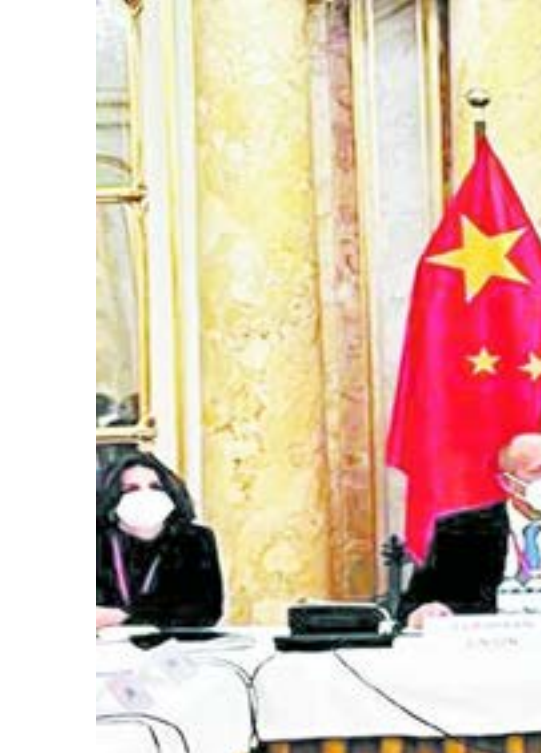
اجتماع وزراء الخارجية في فيينا