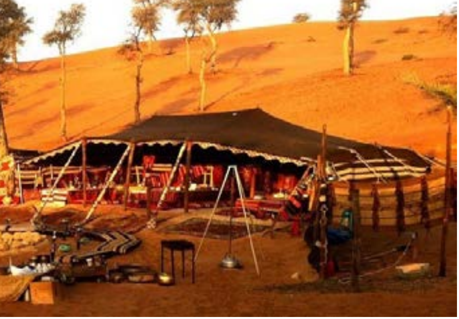
دواوين عشائرية في منطقة الدواوين

وتابع «نناقش في الدواوين العشائرية كافة الاوضاع الاجتماعية والإنسانية، والاحتكاك