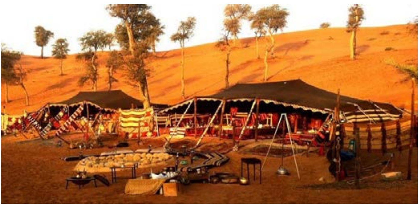
دواوين عشائرية في منطقة الدواوين

من بعض الأشخاص الذين لهم عليه تلك الدية أو الثأر، فهو يدخل ويحتمي في بيت