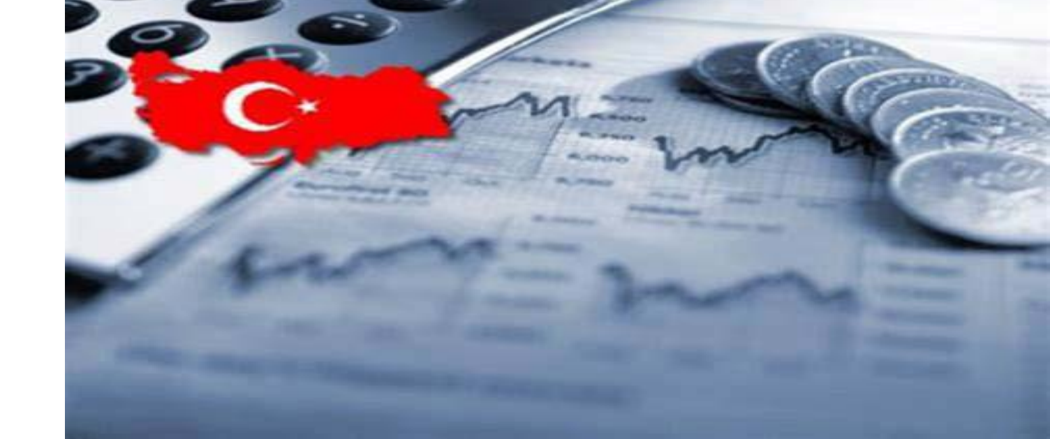
بعد الانخفاض غير المسبوق لليرة التركية،

انزلعت أعمال شعب في مختلف أنحاء البلاد، وخرج المواطنون الأتراك في تظاهرات حاشدة في الشوارع الرئيسية في كل من أنقرة وإسطنبول وإزمير ومدن أخرى، احتجاجاً على الأزمة الاقتصادية وغلاء المعيشة.