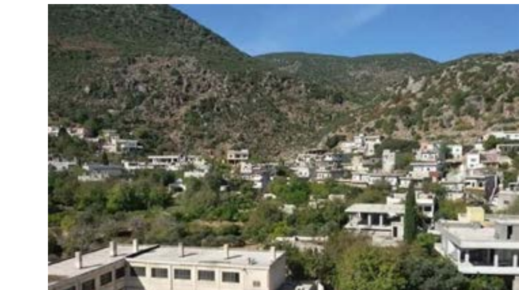
واصلت شركة الكهرباء في إدلب

مشروع المحور الإقليمي تيزين – متئين – الربيع.عام الطيور ككفرعصم وينتهي إلى مجرى نهر الساروت الذي اعدت دراسته منذ عام ٢٠١٠ وتم توقيف العمل به منذ بداية الأحداث علما ان الفعاليات الشعبية والأهلية في القرى المذكورة يطالبون باستمرار بضرورة البدء بتنفيذ هذا المشروع الاستراتيجي والحيوي لأهالي المنطقة ومزارعيها».