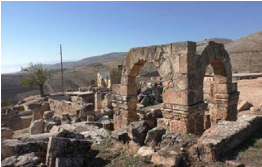
حماة/ جماتة خالد

يقع موقع حورته الأثري على بعد ١٧ كم شمال مدينة أفياميا، ويعد أحد أهم المواقع الأثرية في سورية بل في العالم، حيث توجد منه خمسة مواقع فقط مشابهة له، ضم الموقع في طياته معالم أثرية وكنيستين إحداهما قائمة على أنقاض