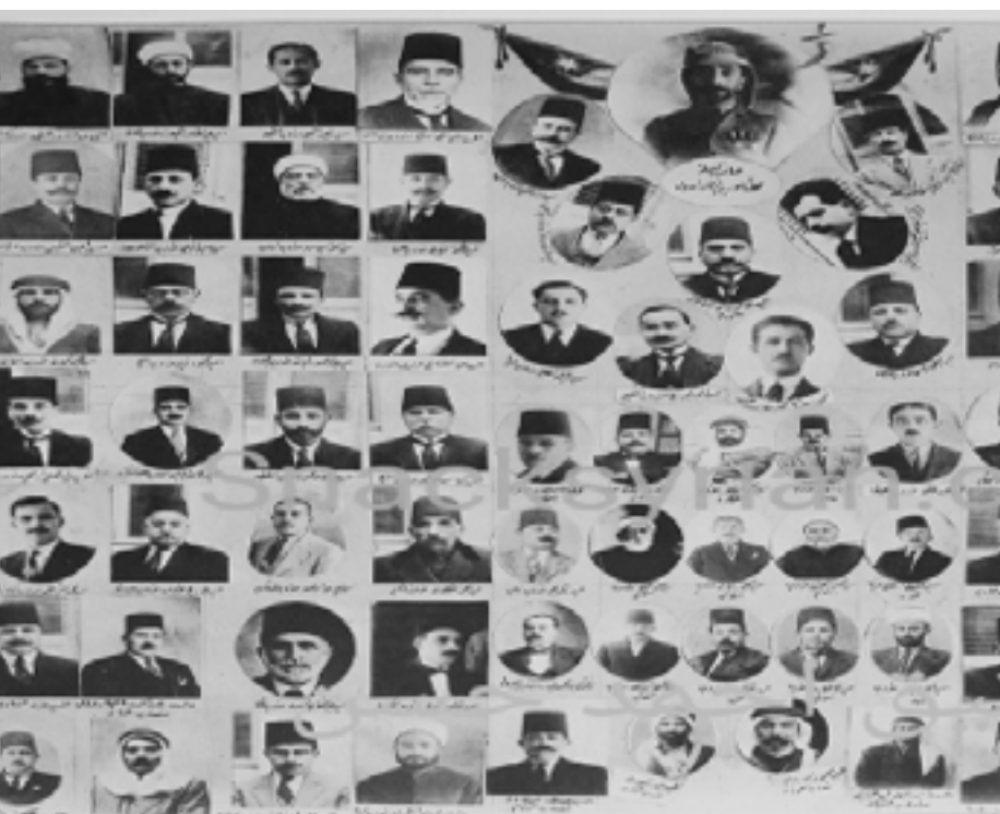
السوريين، إلى جانب مقاعد البدو العشرة.

وكانت مشكلة المحاصصة قد احتدمت حول تفسير المادة السابعة من الدستور التي تنص على تمثيل عادل للأقبليات في مجلس النواب، وتم الخلاف حول تخصيص المقاعد لكل طائفة من الطوائف، أو حصر الموضوع على المسيحيين واليهود دون طوائف الأقبليات المسلمة، أو اعتبار الأقبليات كتلة واحدة