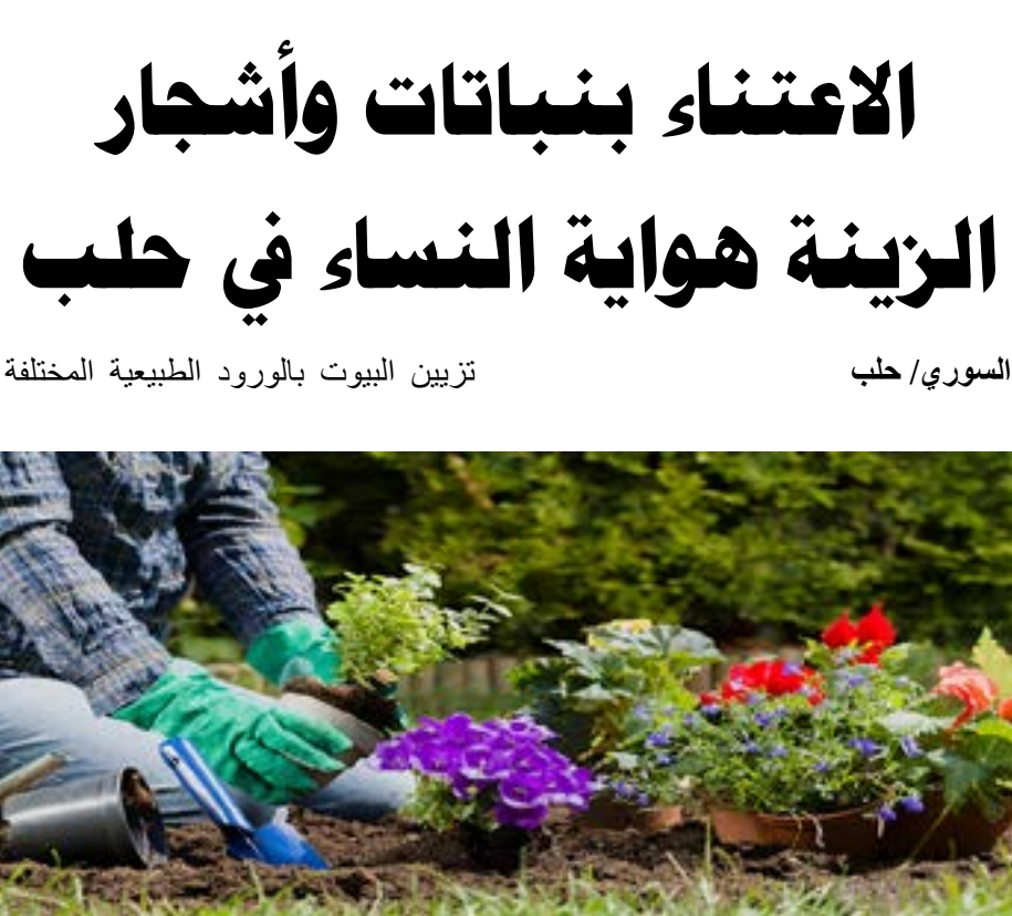
تزيين البيوت بالورود الطبيعية المختلفة

والشجيرات المتنوعة هو من الأمور الشائعة والمحبية إلى قلوب أهالي مدينة حلب، فلا يمكن أن ندخل بيتاً حلبياً دون أن نرى صبارات صغيرة مزروعة بعناية في أنية فخارية أو مجموعة كبيرة من نباتات الزينة المتنوعة والتي تصفني على تلك البيوت المزيد من الجمال والروعة.