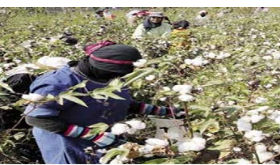
المحبوب ب ٢٥٠٠ليرة سورية.