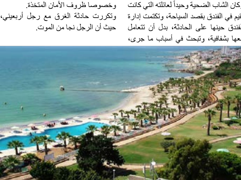
أحد المنتجعات باللاذقية، حيث قام العاملون والمشرفين على هذا المنتجع ببيع خروفين، وتوفي شاب يبلغ من العمر ١٥ عاماً، غرقاً في مسبح المنتجع، في شهر أيار الماضي، قبل أن يتعرض شخص آخر لحظر الغرق خلال شهر تموز، حيث تم إقناذ حياته باللحظات الأخيرة.

وكان الشاب الضحية وحيداً لعائلته التي كانت تقيم في الفندق بقصد السياحة، وتكتمت إدارة الفندق حينها على الحادثة، بدل أن تتعامل معها بشفافية، وتبحث في أسباب ما جرى،