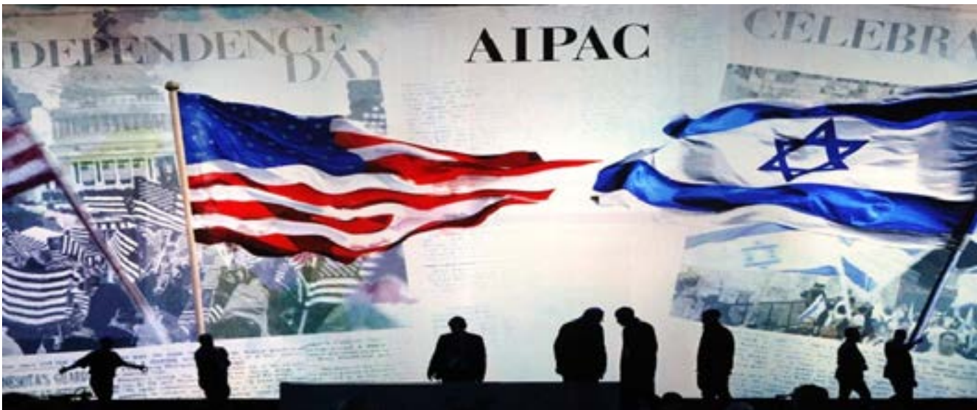
بيد طالبان الإسلامية.

وتابع «كل هذا سيزيد العبء على طالبان والدول المجاورة لها، الذين وجدوا في الهدوء الأفغانستاني المؤقت، فرصة لترميز مشاريعهم السياسية والاقتصادية في تلك المنطقة طيلة أعوام العشرين الماضية.