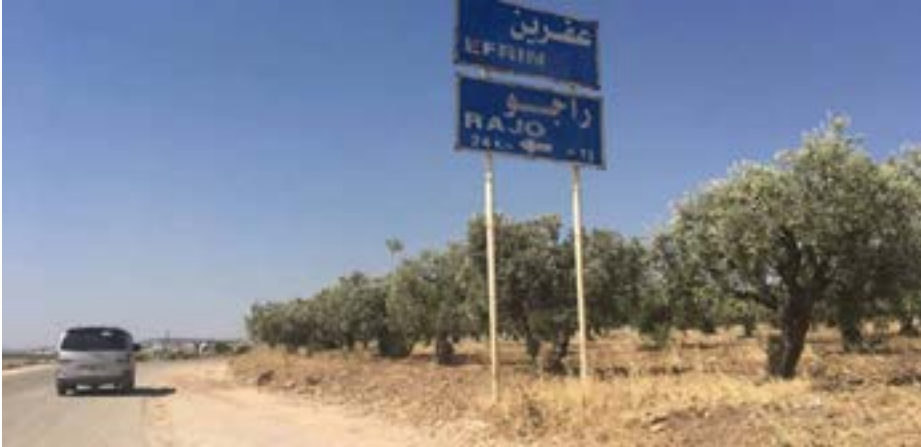
تستمر الفصائل الإرهابية التابعة للاحتلال

وتختتم البطولة القارية بعد أسبوع من اليوم، ويطمح فيها ميسي لتحقيق لقبه الدولي الأول مع «راقصي التانغو».