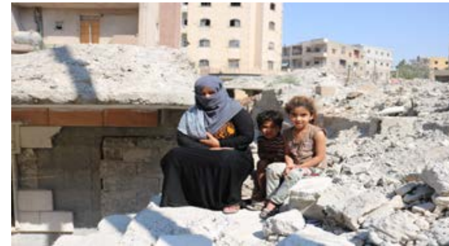
المدنية من جانب، وانتشار المنظمات الإنسانية فيها.

وتشهد مناطق شمال شرقي سوريا بشكل عام اكتظاظا بشعرا بالآلاف من النازحين من المناطق السورية الأخرى،