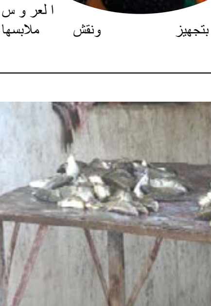
وتتابع «تقوم بشراء هذه اللوازم من المدينة، فعندما يجتمعنا النسوة لذهاب إلى السوق نقوم بتوصيتهم لجليبها كما تعرفون أن العادات والتقاليد قديما كانت لا تسمح للفتيات باللنز و ل