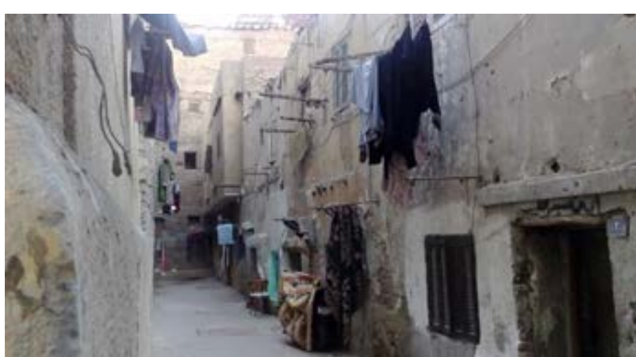
وأردف «أغلبية المنازل التي أصحابها ليسوا فيها إن كان بفعل الحرب أو التهجير أو مغادرة البلاد عندما يعودون سيجدون منازلهم مستعمرات لأفغانين وأسيويين من الذي يقتلون إلى جانب الميليشيات الإيرانية في سوريا، حيث أن المنطقة لا توجد فيها ملاحم دمار كما في بقية مناطق العاصمة». ونقلت عدة مصادر إعلامية ومحلية، أن إيران قامت بشراء مئات العقارات بأسعار رخيصة، عبر تهديد المهجرين بدميرها في حال رفضوا البيع، خاصة أن إيران تقوم بتوسعة مقام السيدة زينب إلى الضعف، وأكدت وكالة «أنباء فارس الإيرانية»، «إن العمل مستمر رغم تفشي فيروس كورونا المستجد (كوفيد-١٩) واستغل المهندسون الإيرانيون الفرصة للاسراع بالمشروع الإيرانية».

سابقاً يبيع ٨٠٠٠ آلاف دولار، عن طريق أحد السماسرة والذي ينوب عن قائد إحدى الميليشيات الإيرانية.