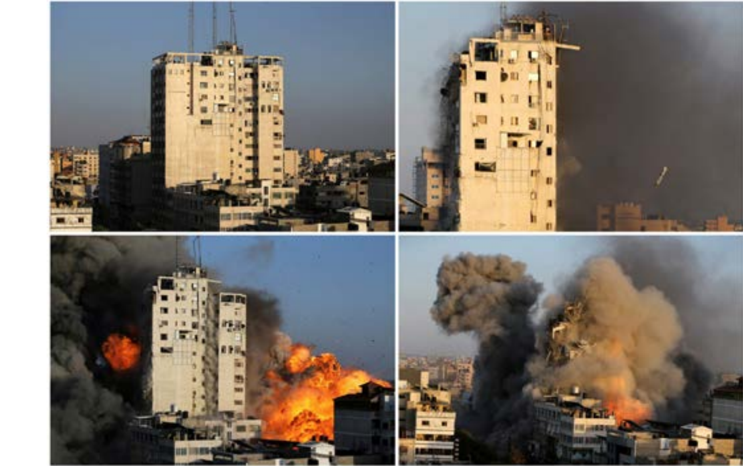
منظر من مدينة نابلس يبين الدخان الكثيف المتصاعد من جراء قصف إسرائيلي على المدينة.

كما أثبتت المقاومة استعدادهامواجهة كل الإحتلالات بما فيها العمليات البرية التي يهدد بها الإحتلال الصهيوني. وهذا ما ذهب إليه الناطق باسم «سرايا القدس» الجناح العسكري لحركة الجهاد الإسلامي الرئيسية حالياً، «رغم أنه ينبغي لأوروبا أن تكون أكثر حذراً».