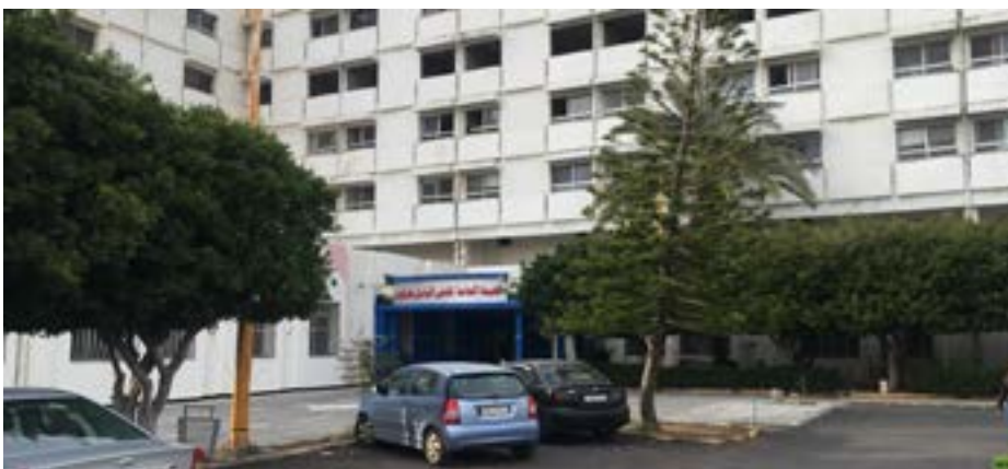
طرطوس/١- ن كورونا في محافظة طرطوس لإعلان عدة مشافي عن عدم استطاعتها استقبال المزيد

وقال المرصد السوري عن مصادر لم يسما أن أكثر من ٧٠ ألف حالة إصابة في مناطق سيطرة الحكومة، على عكس الرواية الرسمية التي تتحدث عن ٢٥ ألف فقط.