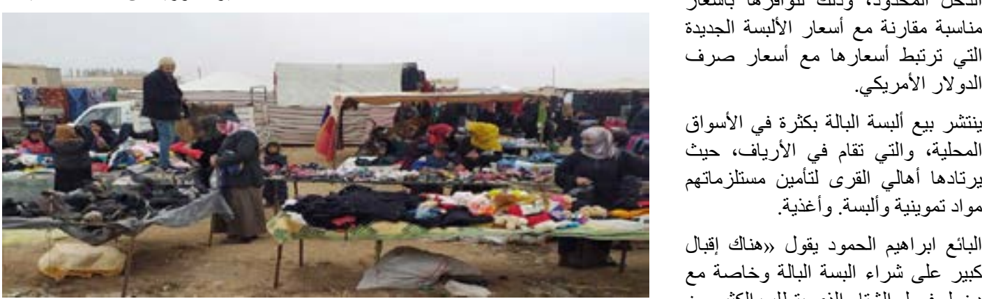
ينتشر بيع البيسة البالية بكثرة في الأسواق المحلية، والتي تقام في الأرياف، حيث يرتادها أهالي القرى لتأمين مستلزماتهم

تشهد أسواق الألبسة الأوربية المستعملة إقبال كبير من قبل الأهالي وخاصة ذوي الدخل المحدود، وذلك لتوافرها بأسعار مناسبة مقارنة مع أسعار الألبسة الجديدة التي ترتبط أسعارها مع أسعار صرف الدولار الأمريكي.