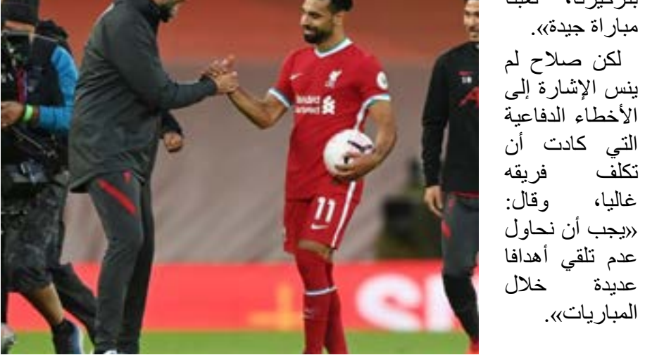
أوساكا في ٢٠١٧

وكان قناع أوساكا في النهائي لصبي عمره ١٢ عاما قتله الشرطة، بينما كان يلعب بلعبة على شكل مندس في كليفلاند في أوهايو في ٢٠١٤.