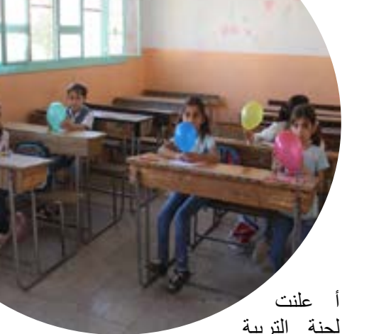
استمرار العملية التعليمية في المدارس من تاريخ افتتاحها في يوم الأحد ٢٠٢٠/٩/٢٧م، للعام الدراسي

السوري/ الرقة - تتابع إدارة المدارس في لجنة التربية والتعليم في منطقة الرقة وريفها، الخطط الدراسية للمدارس ضمن الفصل الأول من عام ٢٠٢٠م، بعد انقطاع الطلاب عن الدراسة لمدة تجاوزت الستة أشهر. في حين استقبل الكادر التدريسي من معلمي ومعلمات المدارس في مدينة الرقة العام الدراسي الجديد ٢٠٢٠/٢٠٢١م، باتباع قواعد التباعد الاجتماعي بغية تشجيع الطلاب للاتحاق بالمدارس والحد من انتشار وباء كورونا، بالاعتماد على الوتشي الصحي واتباع وسائل الوقاية من المرض. بينما