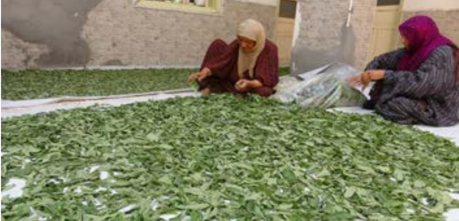
نساء من الرقة يصنعن المونة لفصل الشتاء

وتقوم معظم النساء منذ القدم بإدخال المونة لفصل الشتاء، وتصنع (المربيات - الملوخية - معجون البندورة - الفليفة -حكوس - الأجبان والألبان). واليوم تقوم بعض النساء بالعمل بمجال المونة كمشروع صغير بهدف توفير متطلبات السوق.