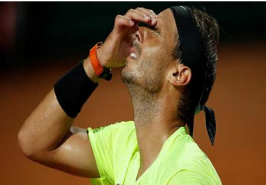
دجوكوفيتش في دورته الأولى في بطولة فرنسا المفتوحة

بوليا بوتينستيفا بسبب الإصابة خلال مواجهة بنيفما. وسيطرت الرومانية على اللقاء