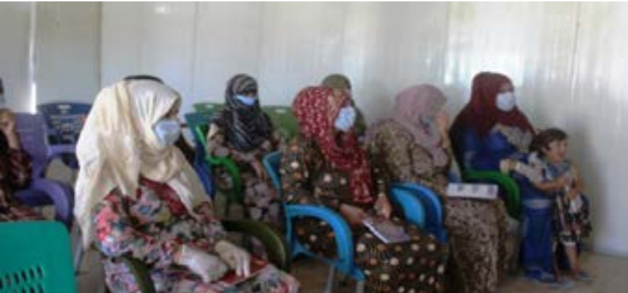
لسيطرة الاحتلال التركي.

من النازحين الذي هُجروا بفعل العملية العسكرية التي شنتها تركيا ومرتزقتها على المدينة، والتي تخضع منذ أكتوبر الماضي