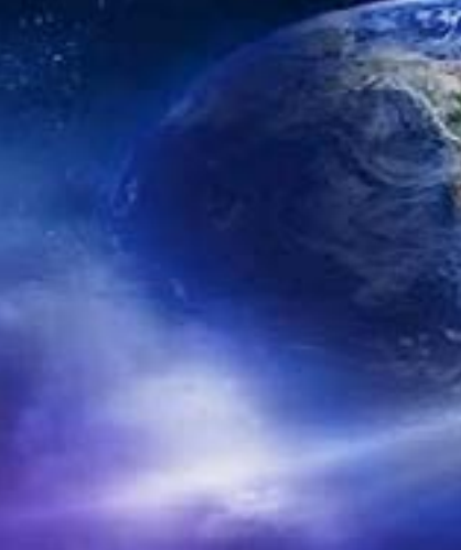
الغازات المسببة للاحتباس الحراري.

وهناك إجماع علمي على أن هدف الحد من متوسط ارتفاع درجة حرارة الأرض عند ١,٥ درجة مئوية، كما ورد في اتفاقية باريس للمناخ عام ٢٠١٥، بعيد المنال بشكل شبه مؤكد، إذا انخفضت معدلات انبعاثات