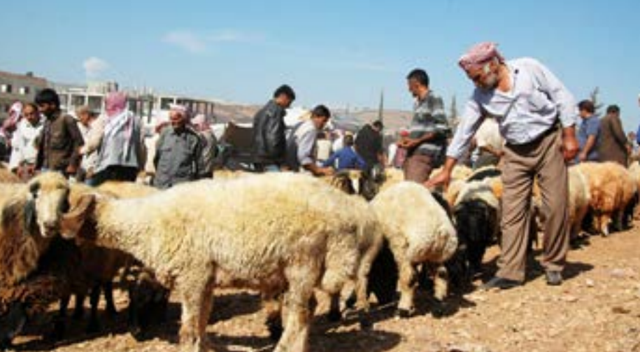
مواشي ريف إدلب قرب مدينة حلب

السوري/ إدلب - أدى الارتفاع الكبير في أسعار المواشي لعزوف معظم سكان إدلب، شمال غرب سوريا، عن شراء الأضاحي مع اقتراب عيد الأضحى.