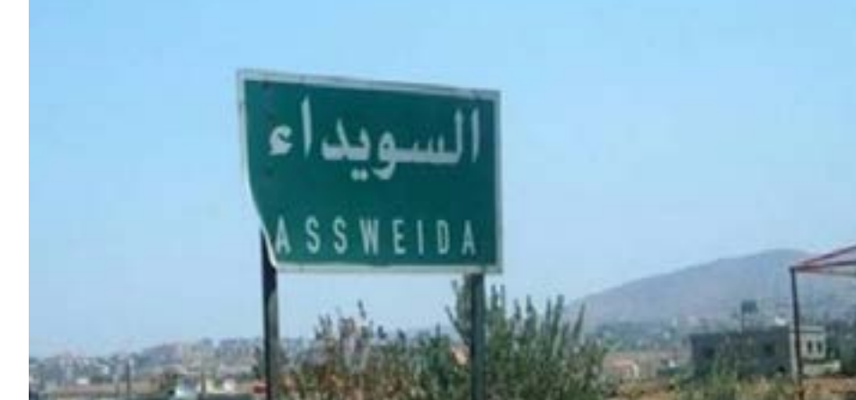
تقرير/ رشا جميل

ما نقوم به من عمل معطاء، بذلنا جهد كبير لتواجه جميع الصعوبات أثناء عملنا».