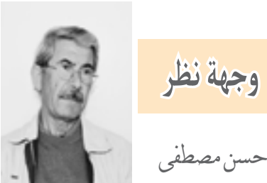
العدد ٣٧ - الثلاثاء ٣ آذار ٢٠٢٠م