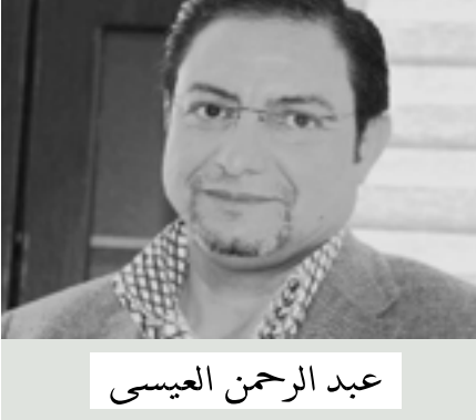
عبد الرحمن العيسى

تصريحاته حول إعادة معظم الموجديين منهم في تركيا إلى بلادهم؟ يجب على اردوغان أن يدرك أنه لن يحصل على تنازل روسي في سوريا، وبالتالي فليس أمامه سوى التصرف كرتينس دولة بحجم تركيا وتنفيذ اتفاق سوتشي والتخلي عن تنظيمات الإرهاب، التي يعطي مصالحتها على مصالح والتراجع بنصيبه من «المكثة»، وأن الرئيس بوتين يمكن أن يسمح لتركيا بالاستفادة مما حققه الدعم الروسي العسكري لنظام الأسد طيلة سنوات مضمت منذ بداية الأزمة في سوريا، وبالتالي أن اردوغان قد رفع سقف توقّعات الشعب التركي بتصريحاته المتكررة حول التحلل التركي في بلبلد، وبات في هذا الشأن ولم تغير خططها، بل تقاطر جثامين الجنود الأتراك من سوريا، فضلاً عن تقادم أزمة اللاجئين السوريين بسبب ما يحدث في إدلب، وانهيار حلم اردوغان وغالب على خطته إلى تفنقات إضافية للاجئين بدلاً من