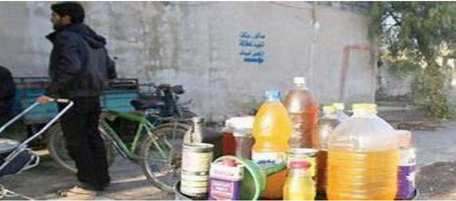
سوق الخضراوات في إدلب

وأصدرت إدارة المحروقات العامة في الإدارة الذاتية لشمال وشرقي سوريا، في ١٦ كانون الثاني/ يناير الماضي، قراراً