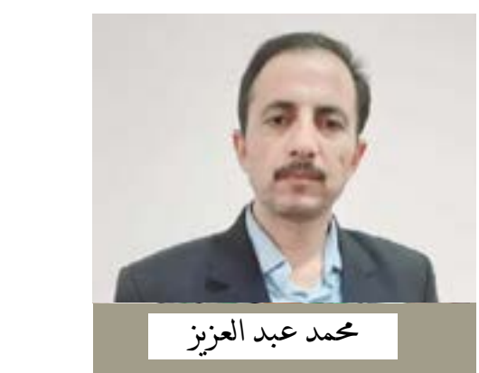
مصنع الخبز في دير الزور