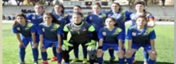
عبرت سيدات نادي عامودا الرياضي عن فرحتهن الغامرة بعد تتويجهن بالدوري السوري للسيدات لكرة القدم قبل نحو خمسة أيام، مؤكّداً على أن هدفهنّ المقبل هو تحقيق نتائج جيدة مع منتخب سوريا السوري.

سيدات نادي عامودا الرياضي عن فرحتهن الغامرة بعد تتويجهن بالدوري السوري للسيدات لكرة القدم قبل نحو خمسة أيام، مؤكّداً على أن هدفهنّ المقبل هو تحقيق نتائج جيدة مع منتخب سوريا السوري.