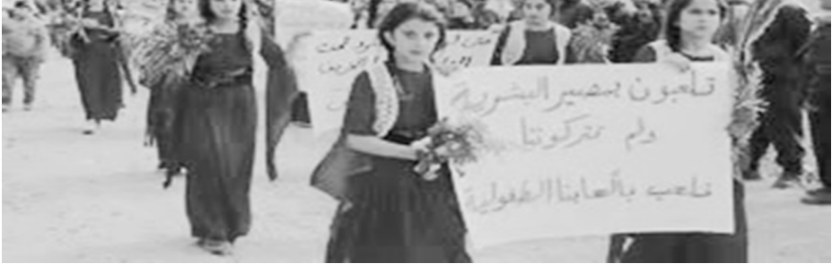
نساء سوريات يشاركن في مظاهرة احتجاجية في حلب

ففي مظاهرتي حبي الشيخ مقصود والأشرفية في حلب؛ شاركت العديد من النساء السوريات في مظاهرات منددة ومستنكرة للمجزرة الكبيرة،