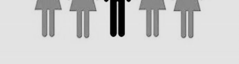
زوجة واحدة لا تكفي شعارا لرجال في رقة

ويرى الرجال أنفسهم بأنهم مفوضون في هذا الأمر، مما زاد بذلك إقبالهم على