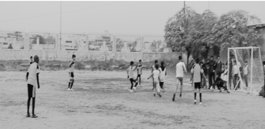
لاعبو فريق كرة قدم من نادي الفرات يلعبون في ملعبهم في رقة

سيتي. وفي رده على سؤال بشأن أوجه التشابه مع مواطنه نيمار قال رونالدنيو إن مهاجم باريس سان جيرمان البالغ عمره (٢٧ عاما) «ترك ناديا كبيرا لينضم إلى ناد آخر كبير حينما غادر برشلونة لينضم لباريس سان جيرمان».